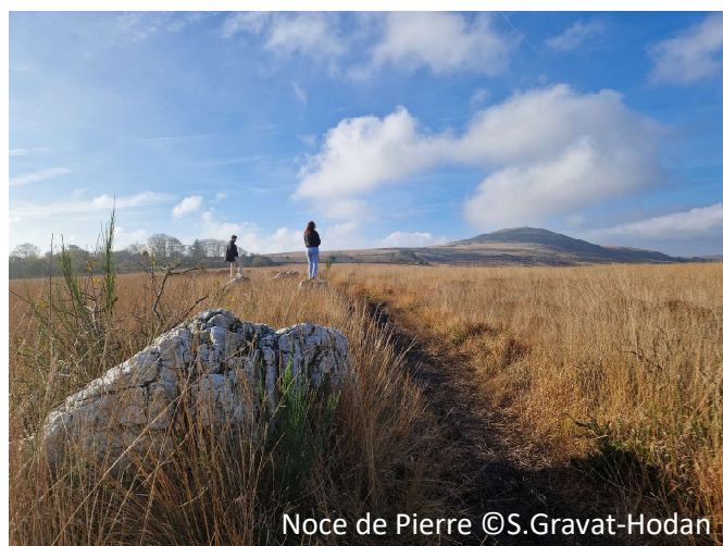
Noce de Pierre

Le bureau de Géole/SGF remercie chaleureusement la SGMB pour la prise en charge de l'organisation et les partenaires pour leur soutien.