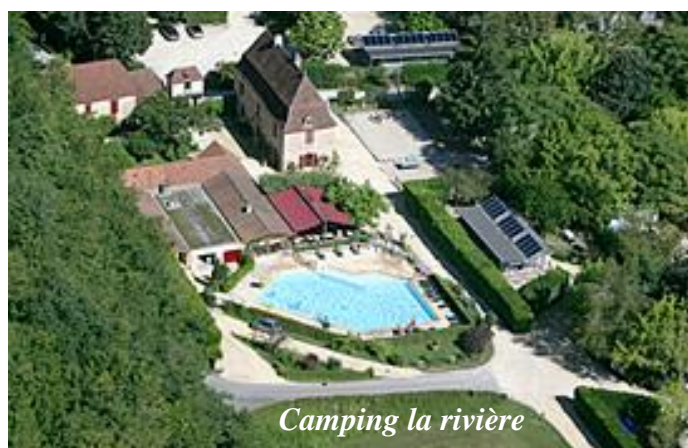
Camping la rivière

Hébergement au camping « la rivière », 3 route du sorcier, 24620 LES EYZIES DE TAYAC SIREUIL : autour de 87€