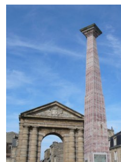
Club Espoir pessacais

Quatre itinéraires à travers la ville de Bordeaux pour découvrir quelques aspects de la géologie à travers l'observation de sites remarquables. Un regard croisé entre environnement, ressources géologiques, architecture et urbanisation.