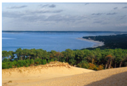
Club Espoir pessacais

Toute l'année 2008 (Calendrier en préparation : voir le site www.aiptaquitaine.net )